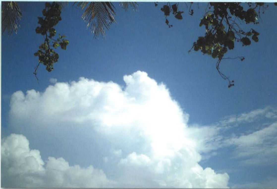
「碧天 モルディブの空」

Our Policy is " For the Society, For the Patient, For Myself "